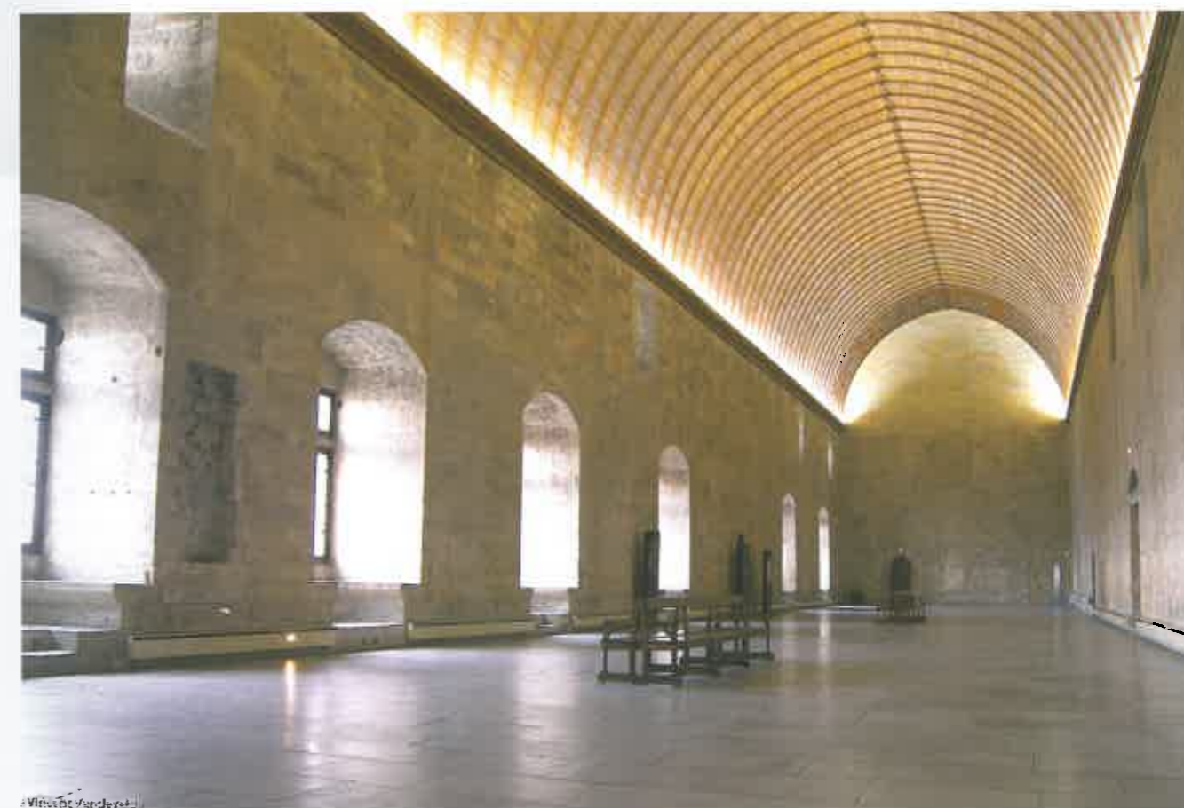
Palais. Intérieur

E n fin de compte, l'Histoire importe-t-elle dans un tel voyage et devant de tels lieux ? Ce n'est pas une question de croyance en Dieu, de pratique de tel ou tel rituel... Mais elle devient pas grand-chose face à la beauté des montagnes. Ce ne sont plus pas non plus des lieux où l'on peut être confusionniste et s'en tirer avec une philosophie émotionnelle spécial vacances ... Les paysages sont là. Ils constituent un langage et celui-ci prépare au silence des églises, à la pureté des lignes des monastères qui certainement ont eu leur architecture choisie en fonction des lignes de paysage qui se dessinent en osmose. Rien ne choque, tout semble se coordonner, et l'effort que l'on fait en se promenant, dans ces terres de montagne, mène à cet état de bonheur que Jean-Jacques Rousseau a su décrire ses voyages dans les Alpes. Il s'était rendu compte que la couleur d'un ciel ou d'un arbre éveille en lui des correspondances profondes avec le visible et le non visible, et ce non visible existe peut-être, même si l'on part du principe des Lumières que Dieu n'existe peut-être pas.