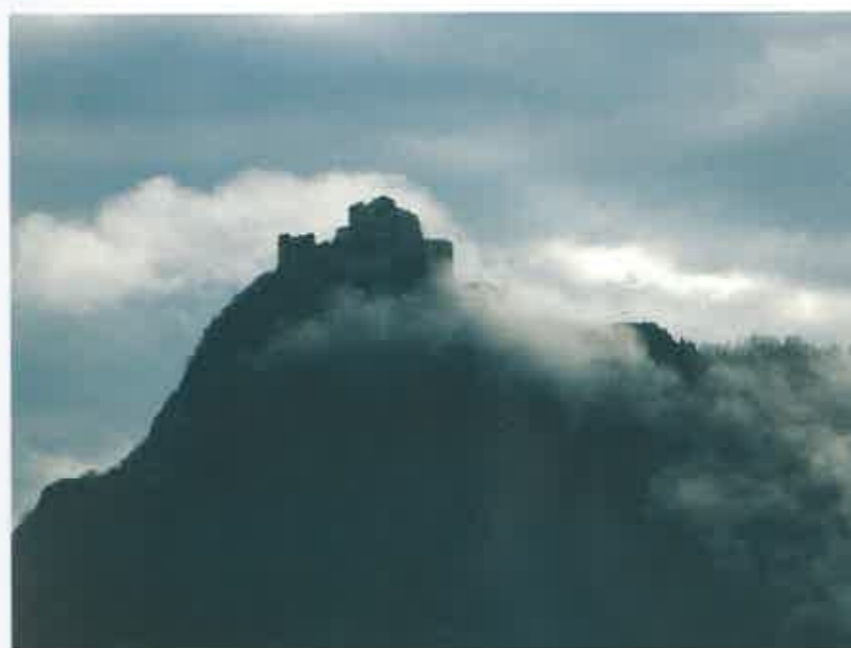
Sacra di San Michele

LA VIA ALTA EST UN RÉSEAU DE ROUTES QUI TRAVERSENT LES ALPES ITALIENNE ET FRANÇAISE. LE PIÉMONT ET LES HAUTES ALPES SE RÉVÈLENT À LA LUMIÈRE DE MAGNIFIQUES PERSPECTIVES. DES PARCS NATURELS, DES ARRÊTS DANS DE JOLIES AUBERGES, DES VUES ROMANTIQUES SUR DES MONTAGNES ET DES VALLÉES QUI SEMBLENT SORTIR D'UN VOYAGE HORS DU TEMPS. ON DIRAIT DES TOILES DE MAÎTRES. PARCS NATURELS, ÉGLISES ROMANES, AIR PUR ET VIVIFIANT... NOUS SOMMES AVEC LES PROMENADES DE ROUSSEAU ET SA NOUVELLE HÉLOÏSE, LORSQUE, RÊVEUR SOLITAIRE, IL ENTRAIT EN OSMOSE AVEC LA NATURE DE CETTE RÉGION.