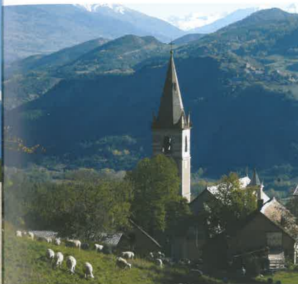
Sanctuaire de Notre-Dame du Laus