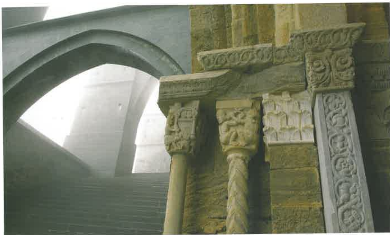
Sacra di San Michele

1857, les moines revinrent, avant d'être chassés en 1903 par les lois sur les congrégations religieuses. Quelques moines se réinstallèrent à Sénanque en 1926. La communauté s'éteindra une nouvelle fois en 1969. La société Berliet signera alors un bail de 30 ans pour y installer un centre culturel, à charge pour elle d'entretenir les bâtiments et d'aider à maintenir le culte.