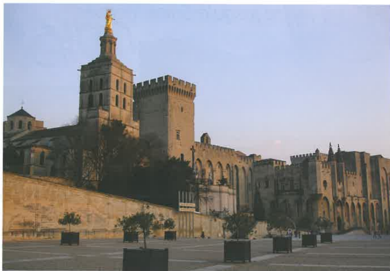
Avignon. Palais des Papes