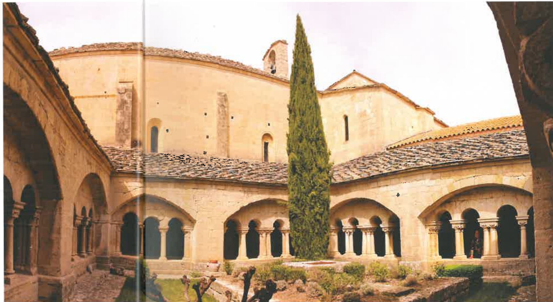
Cloître de Ganagobie.

L'abbaye de Boscodon donne l'impression de chercher à établir un lien tellurique avec le sol, comme pour le tenir et canaliser son énergie. Elle fut la principale maison de l'ordre de Chalais qui fut important dans la Provence et le Dauphiné. Elle fut ensuite bénédictine. Puis monastère dominicain.