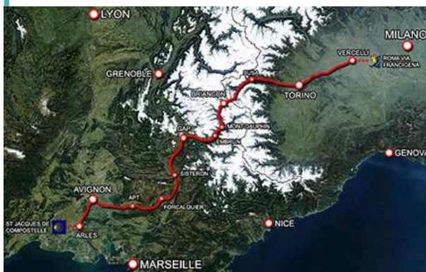
Il percorso della Via Alta

Grande itinerario culturale europeo, come dichiarato dal Consiglio d'Europa, la Via Alta , si estende da Vercelli ad Arles , storiche tappe della Via Domizia , l'arteria romana di comunicazione attraverso le Alpi . Le due città costituiscono storicamente anche le porte d'ingresso del Cammino di Santiago de Compostela e della Via Francigena per i pellegrini che, nel medioevo, si recavano dal Nord Europa a Roma.