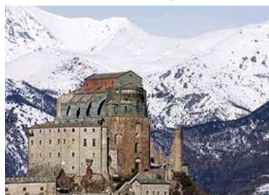
La Sacra di San Michele

La Val di Susa è oggi al centro dell'attenzione dell'opinione pubblica per i cantieri dell'Alta Velocità ferroviaria ma si trascura di ricordarne la particolarità di territorio di confine tra Italia e Francia. Territorio da esplorare a piedi o in automobile, apprezzandone tutta la bellezza e ricchezza. Come gli antichi pellegrini della Via